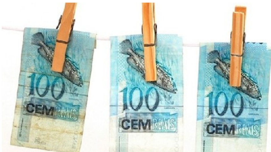
[imagem meramente ilustrativa]

A empresa e seus Colaboradores devem, antes de estabelecer relações de negócios com terceiros, verificar todas as informações disponíveis (inclusive as informações financeiras) destes potenciais parceiros comerciais para assegurar a legitimidade e respeitabilidade de suas atividades. Lembre-se: a Cisa Trading zela por sua boa reputação, e eventuais condutas reprováveis de seus parceiros comerciais podem trazer sérias consequências para a empresa!