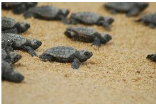
[imagem meramente ilustrativa]

A Cisa Trading reduz ao máximo o impacto ambiental inerente a sua atividade e tem como compromisso proteger a saúde e a segurança, proporcionando um ambiente seguro de trabalho. É dever do Colaborador cumprir as leis ambientais, prevenir acidentes de trabalho, assim como exigir e supervisionar seus visitantes quanto ao cumprimento das medidas de segurança e saúde.